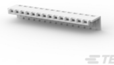
TE 产品编号 1-643067-5 15P MTA156 MOLDED COVER