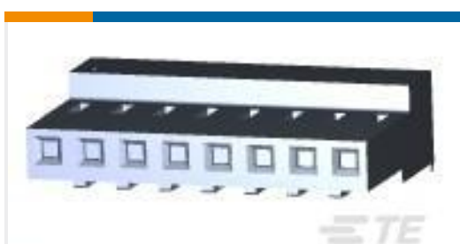
TE 产品编号3-640433-8 08P MTA156 CONN ASSY 22AWG RED