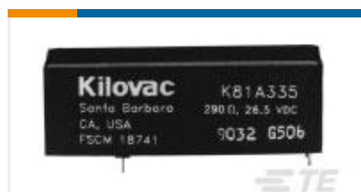
TE 产品编号1618241-5 K81A235=RELAY, VACUUM, SPST-NO