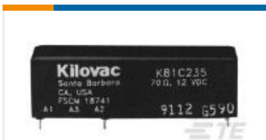
TE 产品编号5-1618241-6 K81C235=RELAY, VACUUM, SPDT