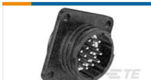
TE 产品编号207292-2 CPC RECPT ASY FEED THRU 17-16