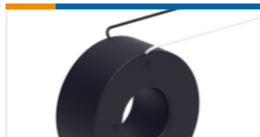
TE 产品编号CG3615-000 CI-2RL500