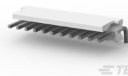
TE 产品编号 1-640389-1 11P MTA156 HDR ASSY SQ R/A F/L