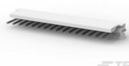
TE 产品编号 1-640388-7 17P MTA156 HDR ASSY RN STR F/L