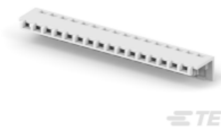
TE 产品编号 1-643067-7 17P MTA156 MOLDED COVER