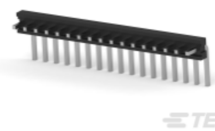
TE 产品编号 1-644751-7 17P MTA156 HDR ASSY R/A