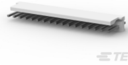
TE 产品编号 1-640445-7 17P MTA156 HDR ASSY FL/STR SN