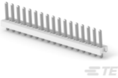
TE 产品编号 1-640383-7 17P MTA156 HDR ASSY STR SQ SN