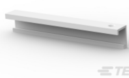
TE 产品编号 1-640551-7 17P MTA156 COVER