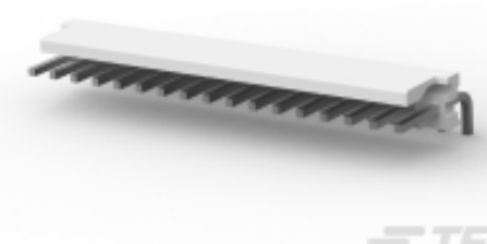
TE 产品编号 1-640389-7 17P MTA156 HDR ASSY SQ R/A F/L