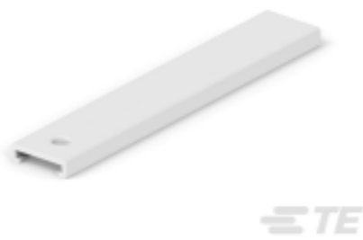
TE 产品编号 1-640643-7 17P MTA156 COVER F/T