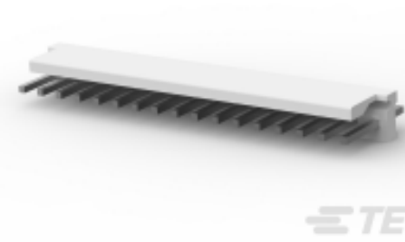
TE 产品编号 1-644752-7 17P MTA156 HDR ASSY SQ STR F/L