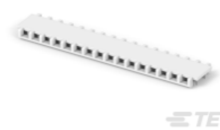
TE 产品编号 1-643071-7 17P MTA156 FD-THRU COVER