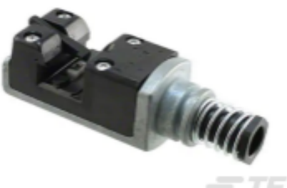
TE 产品编号 58247-3 MTA 156 CRIMP HEAD PRODUCTION RBBN CABLE