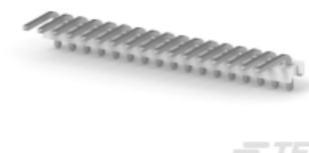
TE 产品编号 1-640385-7 17P MTA156 HDR ASSY SQ R/A