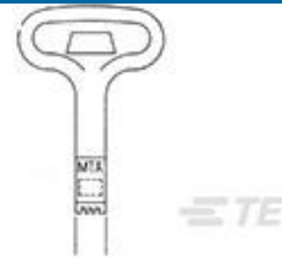
TE 产品编号 59804-1 MAINTENANCE TOOL