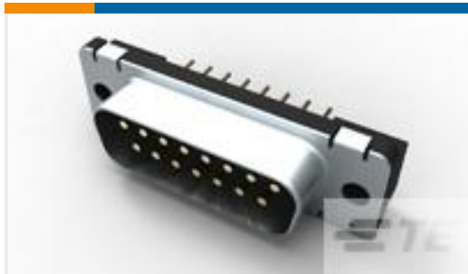
TE 产品编号5747872-8 15 PLUG SP/FMS INSRT