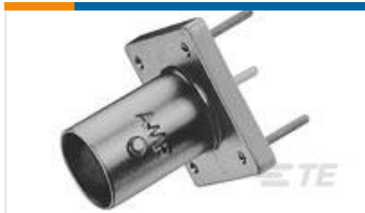
TE 产品编号227699-1 BNC PCB VERTICAL