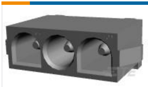
TE 产品编号350429-1 03P UMNL PIN HDR ASSY NATL