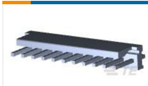
TE 产品编号1-640445-1 11P MTA156 HDR ASSY FL/STR SN