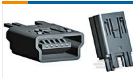
TE 产品编号2041517-1 MINI USB, RCPT,V/T,DIP, B TYPE,30u" Au