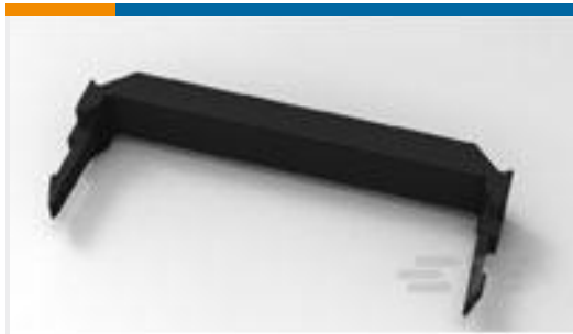
TE 产品编号499252-5 010 STRAIN RELIEF A-L RCPT