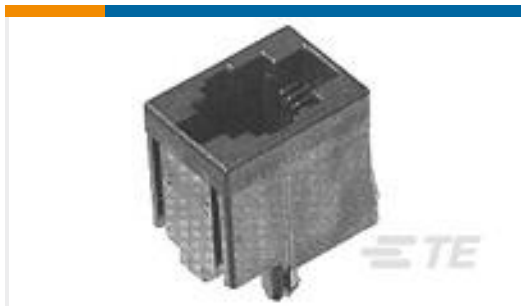
TE 产品编号5520259-4 MJ,TE,8P,TRAYS