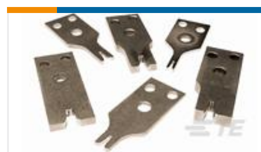
TE 产品编号730462-5 CRIMPER, INSULATION