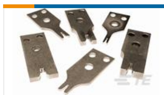
TE 产品编号1633962-3 CRIMPER, INSULATION F PREMIUM