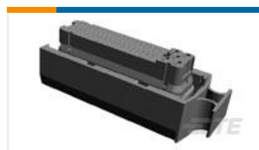
TE 产品编号1-368376-1 81P REC HSG ASSY(SIEMENS)BLK-B