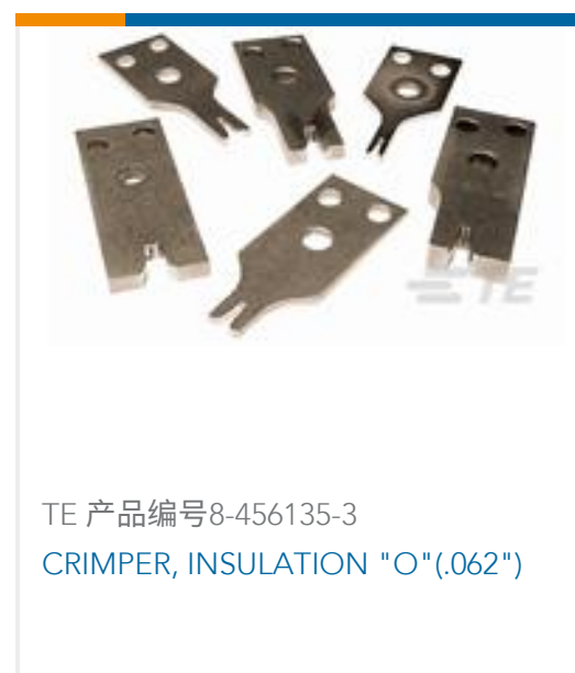
TE 产品编号8-456135-3 CRIMPER, INSULATION "O"(.062")