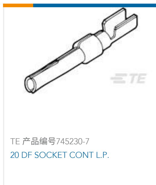
TE 产品编号745230-7 20 DF SOCKET CONT L.P.