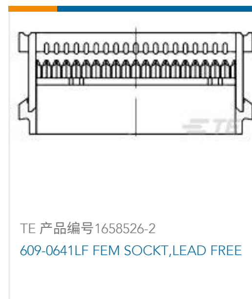
TE 产品编号1658526-2 609-0641LF FEM SOCKET, LEAD FREE