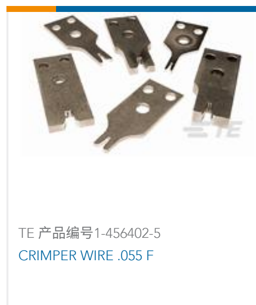
TE 产品编号1-456402-5 CRIMPER WIRE .055 F