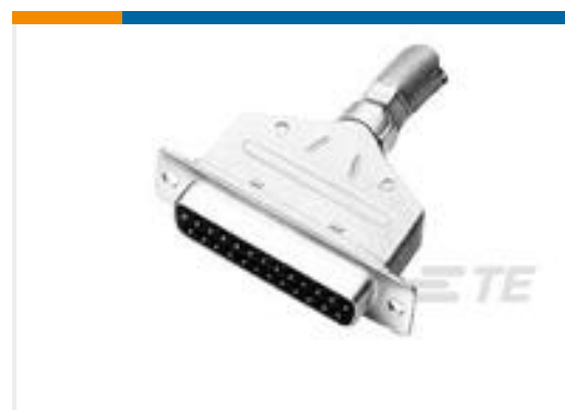
TE 产品编号 747548-8 KIT, RCPT, 25P, HDE, SHLD HDWRE