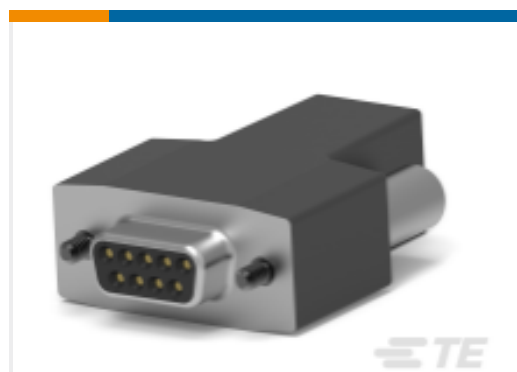
TE 产品编号 CAT-AM7-248H6 IDC D-Sub：插座套件，线对线，信号，2.74mm