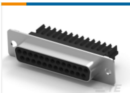
TE 产品编号 CAT-AM7-248H5 IDC D-Sub：插座组件，线对线，信号，2.77mm