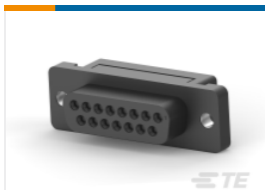
TE 产品编号 CAT-AM7-253 IDC D-Sub：插座组件，小尺寸，信号，2.77mm