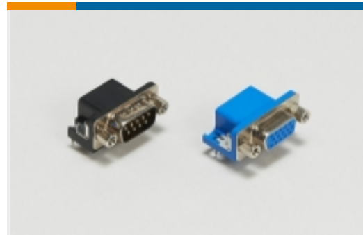
PCB D-Sub 连接器(13)