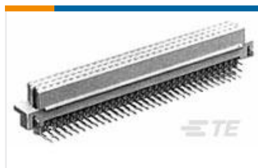
TE 产品编号5650893-5 ASSY,RECEPT,EUROCARD,TYPE R/2,L- FREE,48,