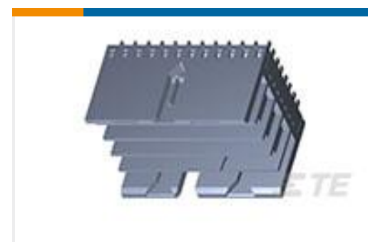
TE 产品编号2042088-2 Vert.Male, IEC L2