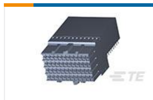
TE 产品编号1982738-2 Female Connector IEC