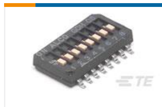
TE 产品编号1-1571983-1 GDH08STR04=DIP SWITCH