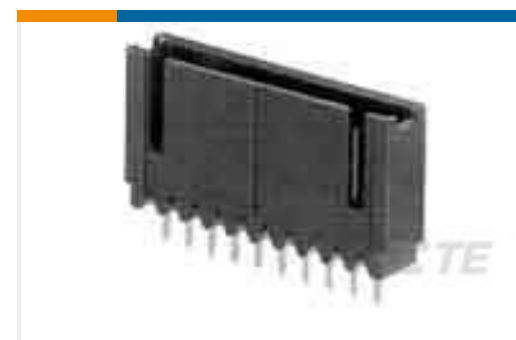
TE 产品编号5-103414-8 10 MODII HDR SRST SHRD LF