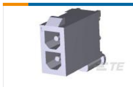
TE 产品编号1-770872-1 02P MINI UMNL HDR ASSY AU LF