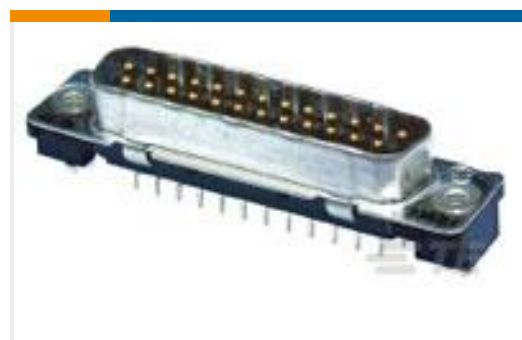
TE 产品编号3-338310-2 15POS.HD20 PLUG ASS'Y