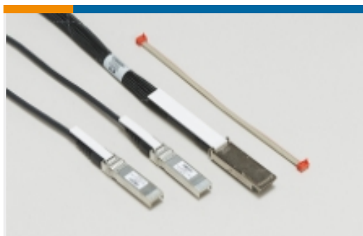
插拔式 I/O 电缆部件(17)