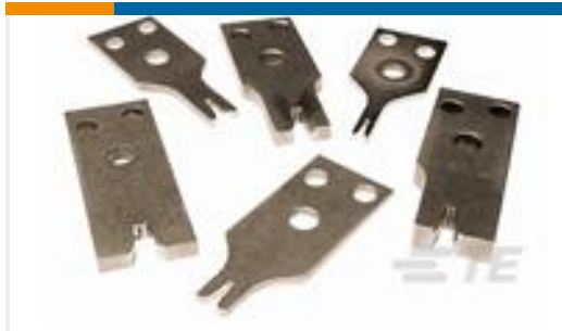
TE 产品编号2-653846-1 DRAHTCRIMPER