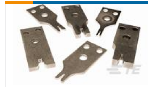
TE 产品编号453804-2 CRIMPER, WIRE-.090 WIDE F