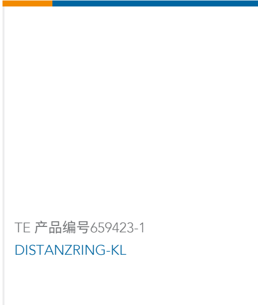
TE 产品编号659423-1 DISTANZRING-KL