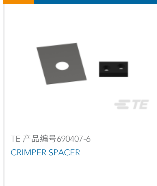
TE 产品编号690407-6 CRIMPER SPACER