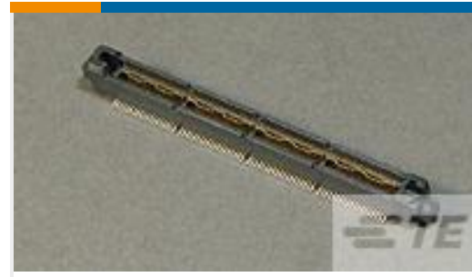
TE 产品编号1-5767111-1 MICT,PLG,152,ASY,.025 TAPE CAP