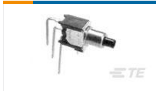
TE 产品编号6-1437571-3 TPB11CGVRA0=TINY PUSHBUTTON