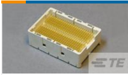
TE 产品编号6-1761616-2 STEP-Z PLUG 12MM 296P LF ST