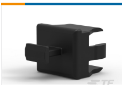
TE 产品编号 2300260-1 MICROQSFP DUST PLUG