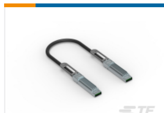
TE 产品编号 2821313-3 MICROQSFP TO MICROQSFP, 2M 28AWG