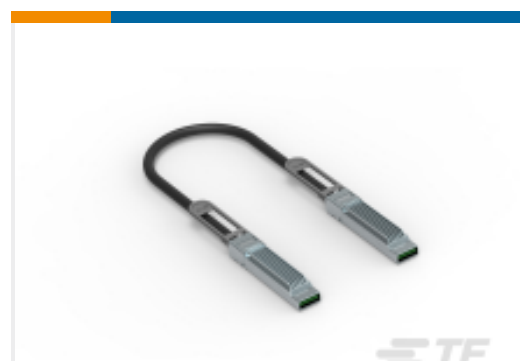
TE 产品编号 2821313-1 MICROQSFP TO MICROQSFP, 0.5M 28AWG