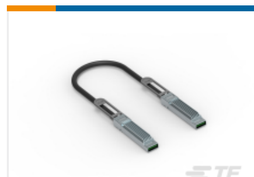
TE 产品编号 2821236-1 MICROQSFP TO MICROQSFP, 0.5M 32AWG