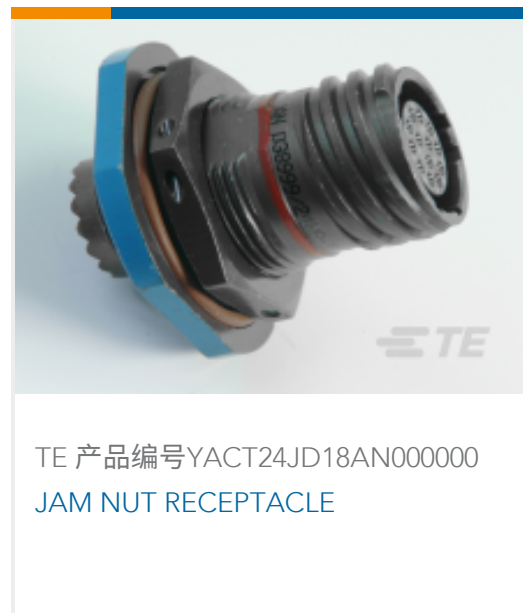
TE 产品编号YACT24JD18AN000000 JAM NUT RECEPTACLE