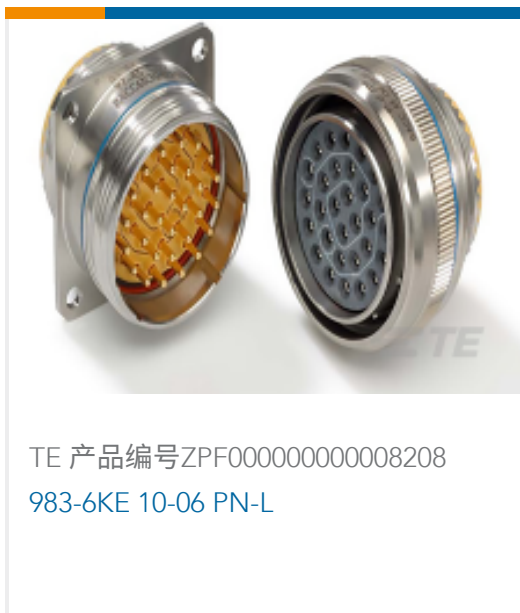
TE 产品编号ZPF000000000008208 983-6KE 10-06 PN-L