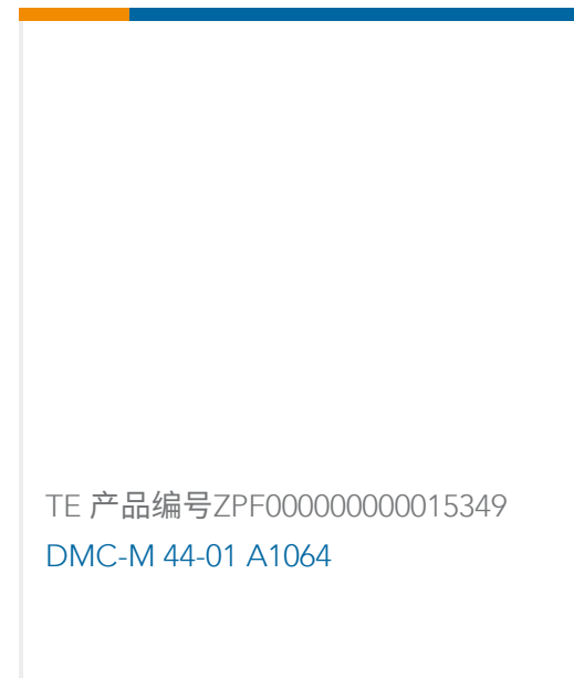
TE 产品编号ZPF000000000015349 DMC-M 44-01 A1064