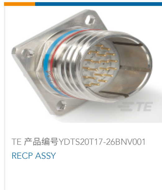
TE 产品编号YDTS20T17-26BNV001 RECP ASSY