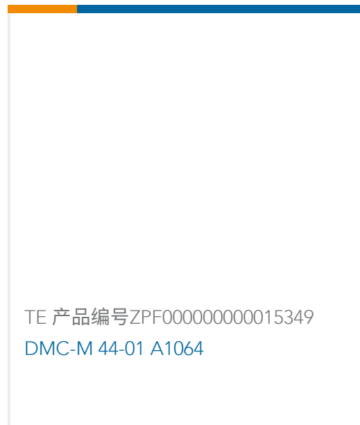
TE 产品编号ZPF000000000015349 DMC-M 44-01 A1064