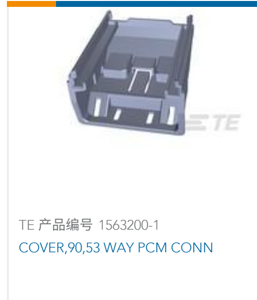
TE 产品编号 1563200-1 COVER,90,53 WAY PCM CONN