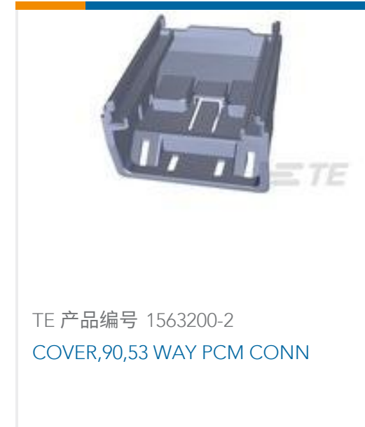
TE 产品编号 1563200-2 COVER,90,53 WAY PCM CONN