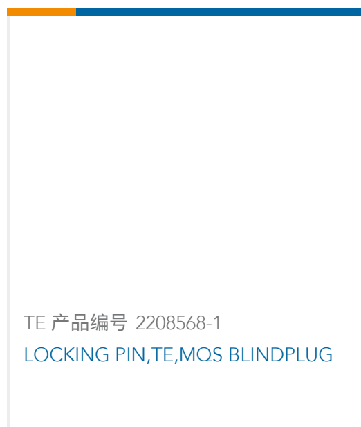
TE 产品编号 2208568-1 LOCKING PIN,TE,MQS BLINDPLUG