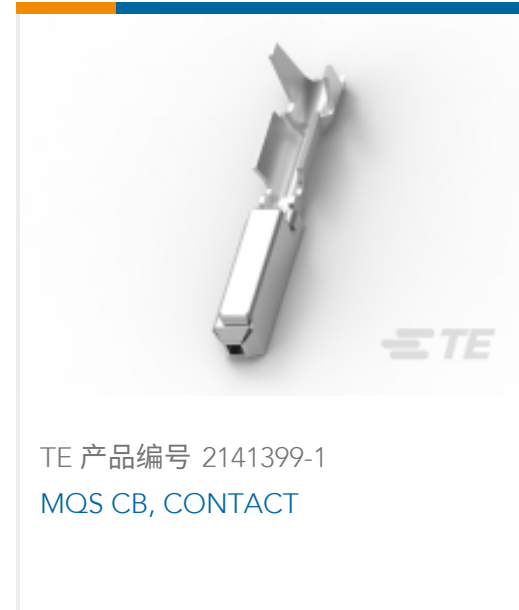
TE 产品编号 2141399-1 MQS CB, CONTACT