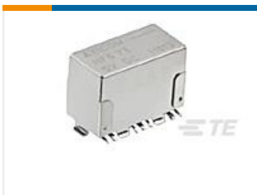
TE 产品编号1462052-3 HF6 53=50OHM140MW 5V MONO