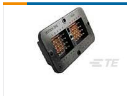
TE 产品编号DRC10-40P-A004 HDR, 40P, BLK, ST, PIN, SN/NI/CU