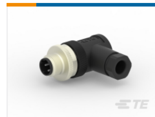
TE 产品编号T4113501041-000 M12,MALE,RA,D CODE,4P,PG7,GOLD