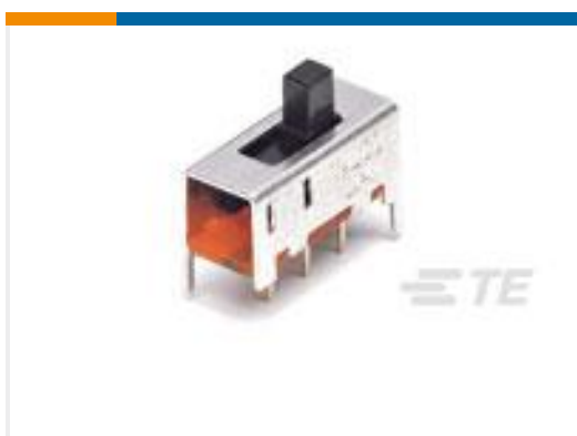
TE 产品编号1825255-1 MHS12204=SPDT SL SW VERT AG