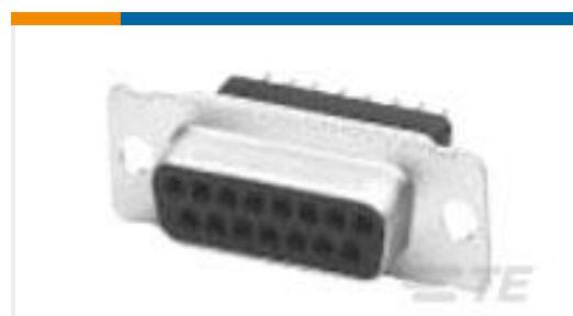
TE 产品编号5745886-2 25 RCPT SP/MS CNUT