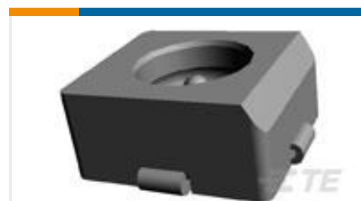
TE 产品编号1055687-1 2367 0000 54, VERT PLUG