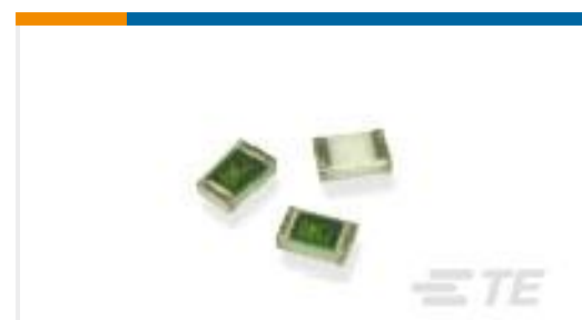
TE 产品编号1676234-2 RN 0805 1K4 0.1% 10PPM 1KRL