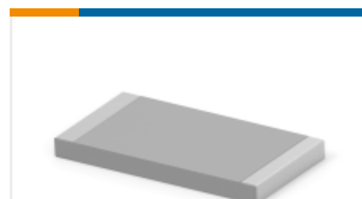
TE 产品编号3-2176331-4 CRGP 2512 5K6 1%