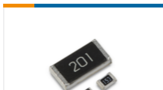
TE 产品编号1-2176326-8 CRGP 0603 270R 1%