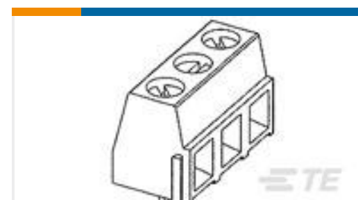
TE 产品编号282836-7 TERMI-BLOK PCB MOUNT 90 7P.