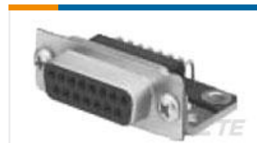
TE 产品编号5745113-2 15 RCPT RA/MS STD