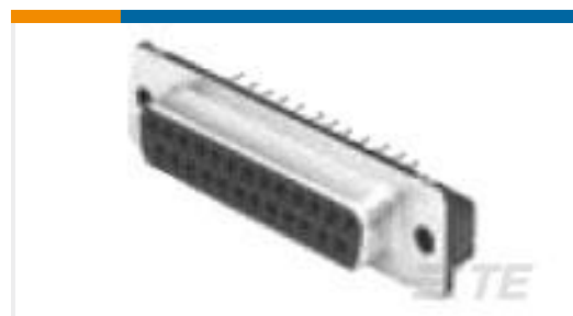
TE 产品编号5747299-2 15 RCPT SP/FMS STD