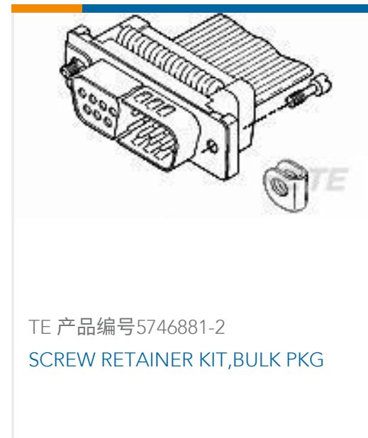
TE 产品编号5746881-2 SCREW RETAINER KIT,BULK PKG