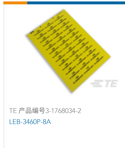
TE 产品编号3-1768034-2 LEB-3460P-8A