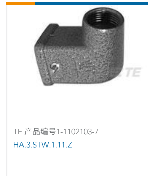
TE 产品编号1-1102103-7 HA.3.STW.1.11.Z