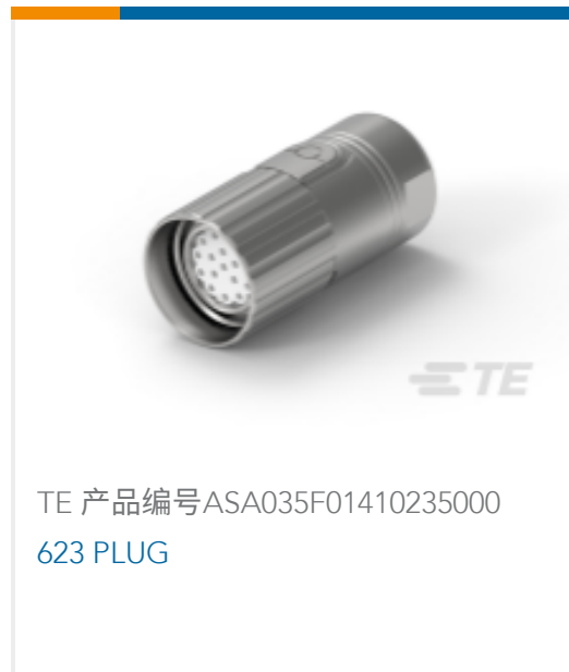
TE 产品编号ASA035F01410235000 623 PLUG