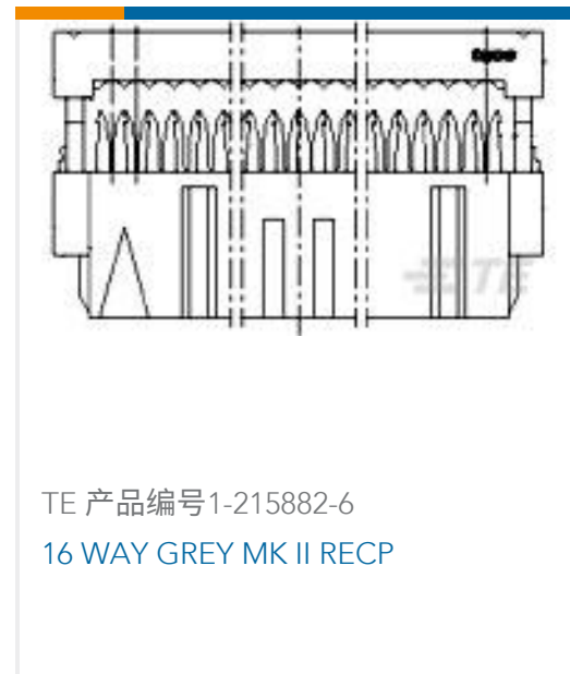
TE 产品编号1-215882-6 16 WAY GREY MK II RECP