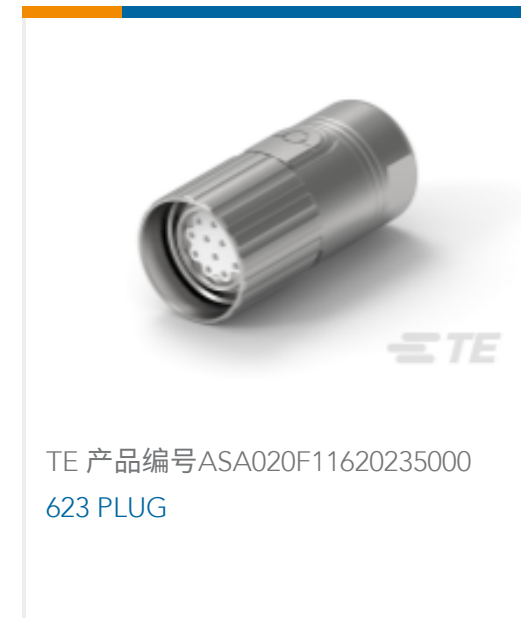
TE 产品编号ASA020F11620235000 623 PLUG