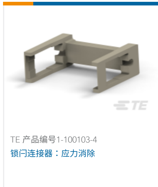
TE 产品编号1-100103-4 锁门连接器：应力消除