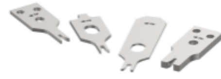
TE 产品编号6-2119785-7 CRIMPER, INSULATION OVERLAP PREMIUM