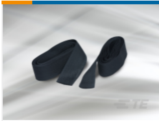
TE 产品编号6979346020 HFT5000 热缩管