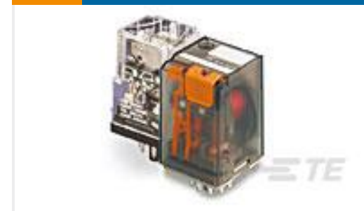
TE 产品编号3-1393104-6 KRPA-11AY-120=KRPA