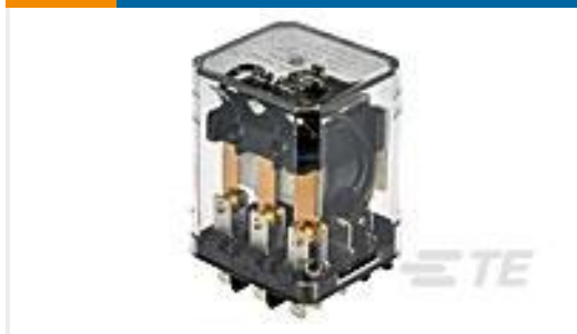
TE 产品编号1-1393118-2 KUP-14D15-110=KU