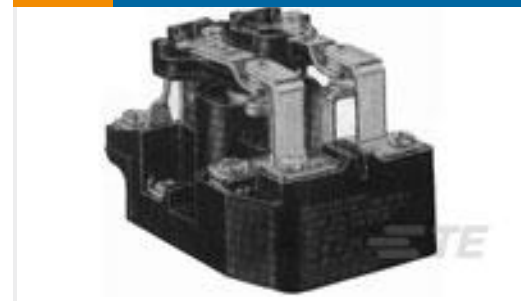
TE 产品编号1-1393130-6 PRD-7DG0-24=PRD