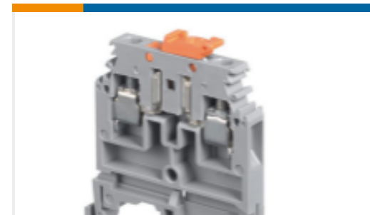
TE 产品编号1SNA115438R1200 M4/6.SNBT