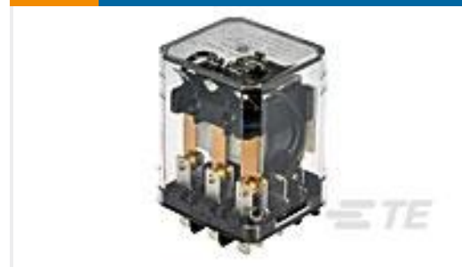
TE 产品编号4-1393117-3 KUP-11D15-110=KU