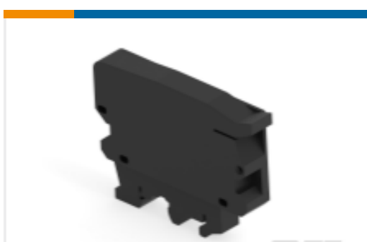
TE 产品编号1SNA199168R0000 ML10/13.SFL