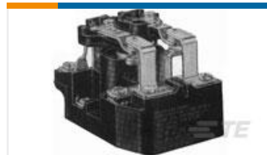
TE 产品编号2-1393127-6 PRD-11AY0-120=PRD