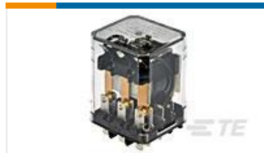
TE 产品编号4-1393117-2 KUP-11D11-24=KU