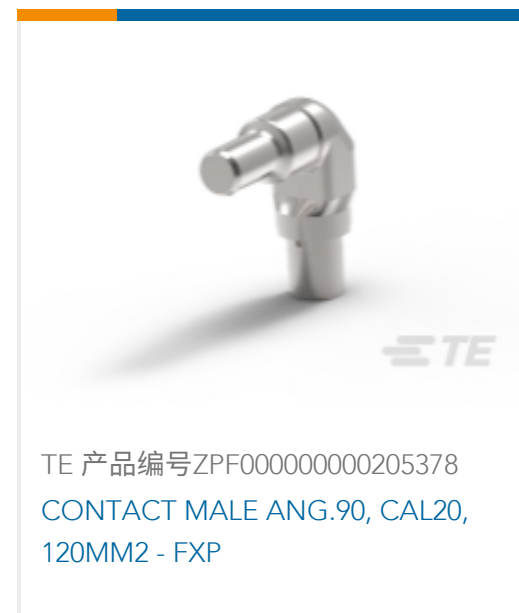
TE 产品编号ZPF000000000205378 CONTACT MALE ANG.90, CAL20, 120MM2 - FXP