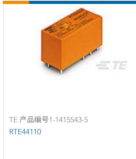
TE 产品编号1-1415543-5 RTE44110