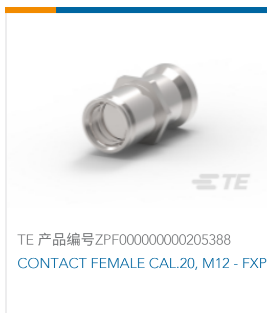
TE 产品编号ZPF000000000205388 CONTACT FEMALE CAL.20, M12 - FXP