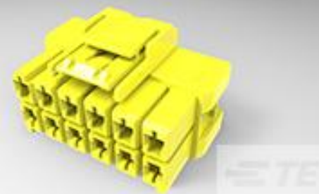
TE 产品编号 4-1971776-6 PTL 2X6 PLUG HSG STD TEMP KEY D YEL