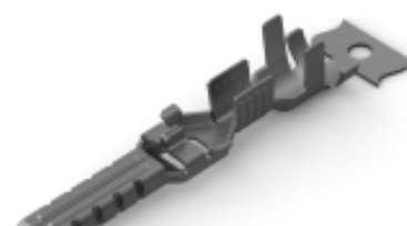
TE 产品编号 CAT-P87074-T111 Tab Contact — POWER TRIPLE LOCK