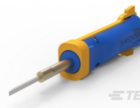
TE 产品编号 1452426-1 EXTRACTION TOOL