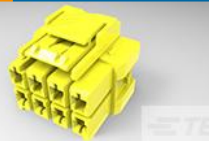
TE 产品编号 4-1971776-4 PTL 2X4 PLUG HSG STD TEMP KEY D YEL