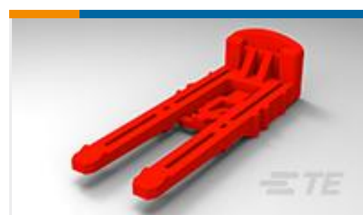
TE 产品编号1971789-1 CPA