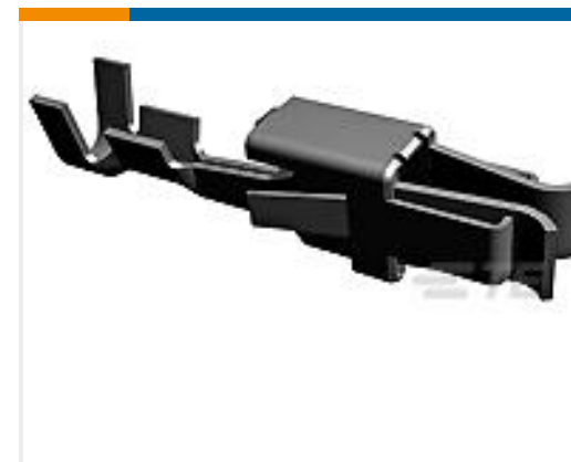
TE 产品编号965901-1 JPT REC 2.8 Contact SRC Sn