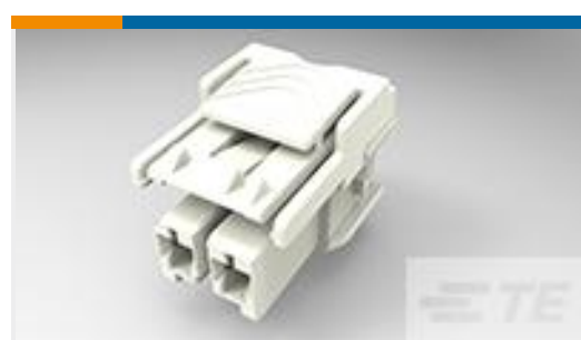
TE 产品编号1-1971773-2 PTL 1X2 PLUG HSG STD TEMP KEY A NAT