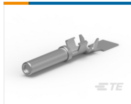
TE 产品编号1062-16-0677 DEUTSCH 16号压接端子