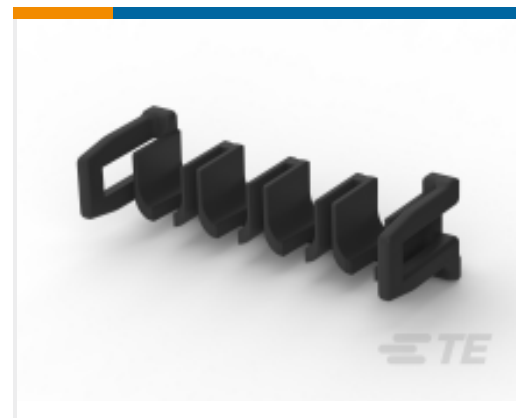
TE 产品编号1971777-2 Locking Plate, POWER TRIPLE LOCK, TPA