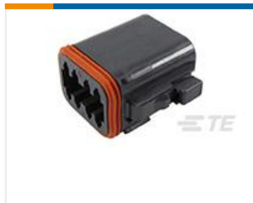
TE 产品编号DT06-08SB-C015 PLG, 8P, BLK, E, B