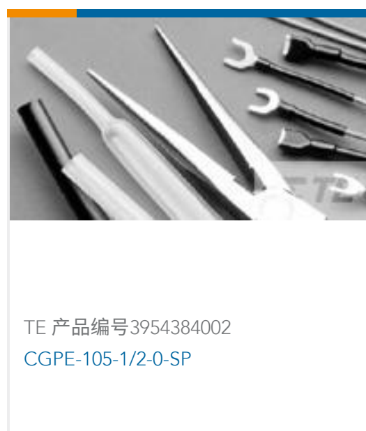
TE 产品编号3954384002 CGPE-105-1/2-0-SP