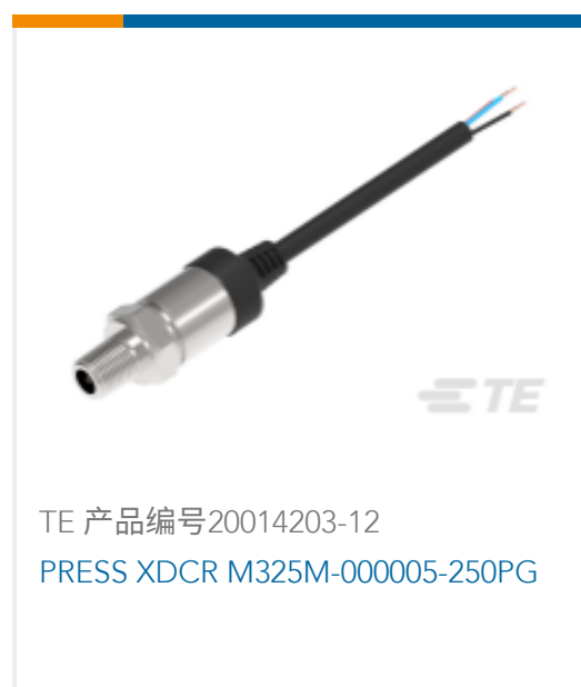
TE 产品编号20014203-12 PRESS XDCR M325M-000005-250PG