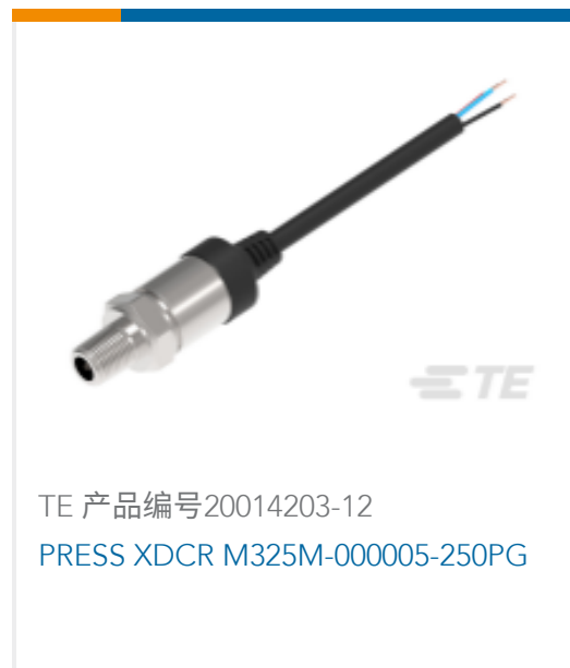
TE 产品编号20014203-12 PRESS XDCR M325M-000005-250PG