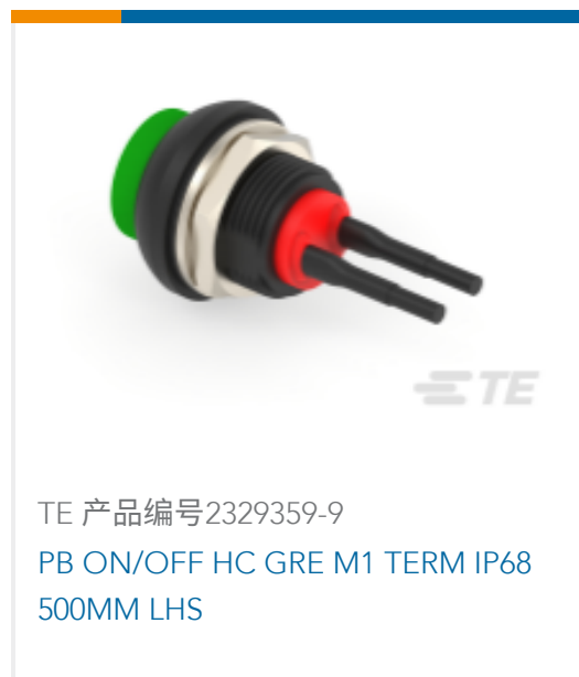
TE 产品编号2329359-9 PB ON/OFF HC GRE M1 TERM IP68 500MM LHS