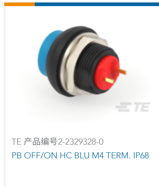
TE 产品编号2-2329328-0 PB OFF/ON HC BLU M4 TERM. IP68