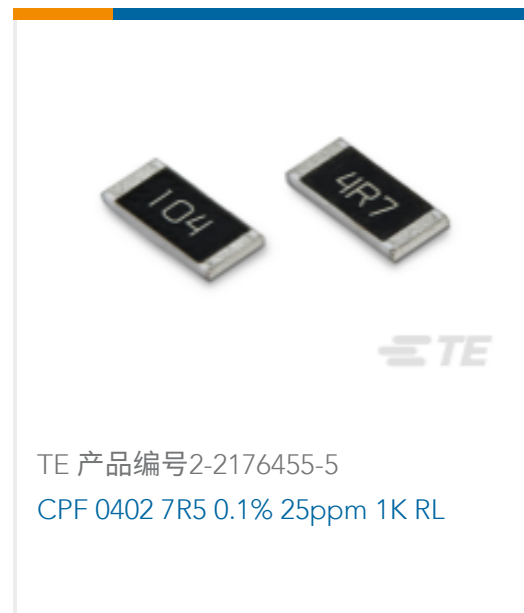
TE 产品编号2-2176455-5 CPF 0402 7R5 0.1% 25ppm 1K RL