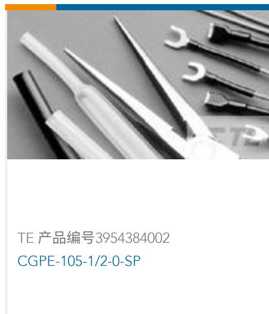
TE 产品编号3954384002 CGPE-105-1/2-0-SP