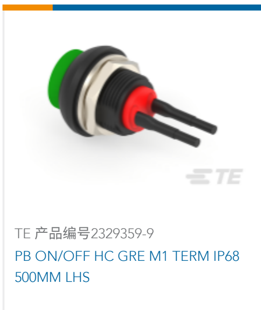
TE 产品编号2329359-9 PB ON/OFF HC GRE M1 TERM IP68 500MM LHS