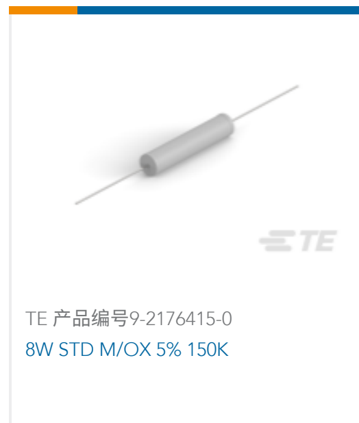
TE 产品编号9-2176415-0 8W STD M/OX 5% 150K