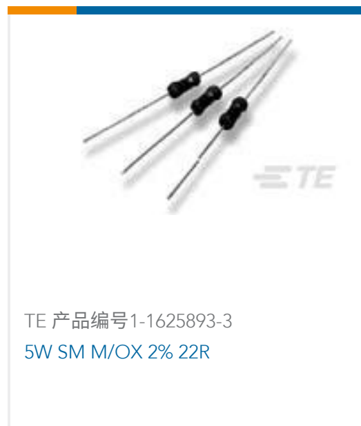
TE 产品编号1-1625893-3 5W SM M/OX 2% 22R