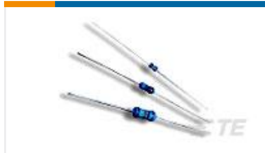
TE 产品编号1622367-1 LR1 1% 1M0