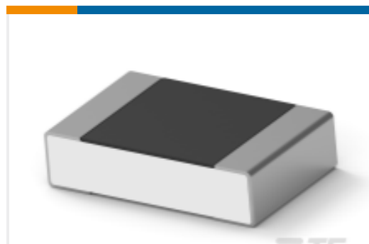
TE 产品编号9-2176373-5 RQ 0805 95R3 0.1% 10PPM 1K RL