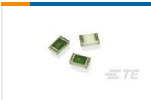
TE 产品编号1676428-2 RN 0805 75R 0.1% 10PPM 1KRL