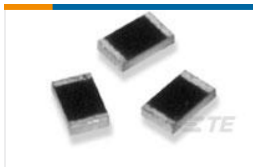
TE 产品编号7-1625865-0 RP 2A 7R87 0.1% 15PPM CUT LENGTH