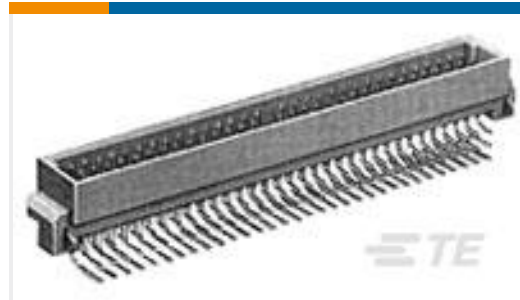
TE 产品编号5650951-5 ASSY,PIN,EUROCARD,TYPE C,LEAD-