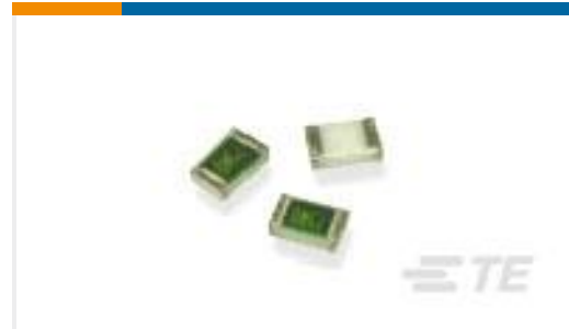
TE 产品编号1676254-2 RN 0805 21K 0.1% 10PPM 1KRL