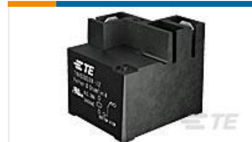
TE 产品编号3-1393210-3 T9AS5D12-12