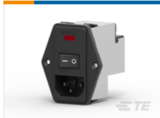
TE 产品编号2-6609104-4 PE0S0DS6B=C1255