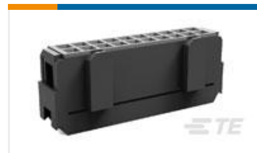
TE 产品编号1658624-1 10 NOVO DUAL 30DP, LEAD FREE