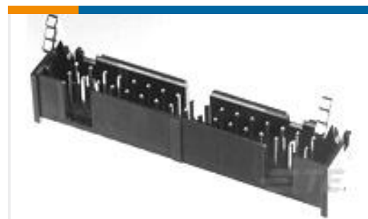
TE 产品编号1761606-6 IDC LOW PRO HDR 16P VERT LG LAT BLK