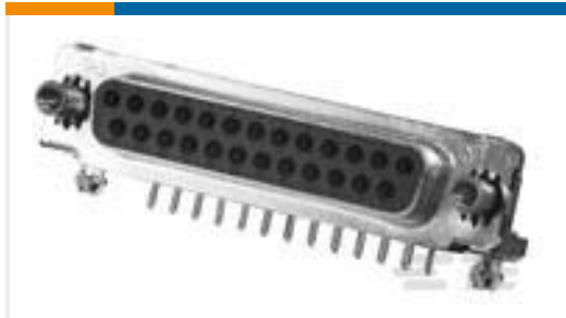
TE 产品编号5747847-6 37 MSFL RCPT RA 318 (SL,FM,BL)