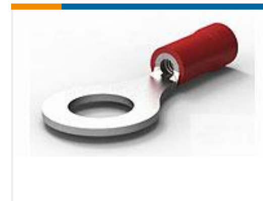
TE 产品编号34150 PG R 22-16 COMM 22-18 MIL 1/4