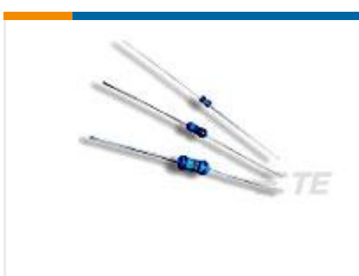
TE 产品编号1622796-2 YR1 0.1% 100R