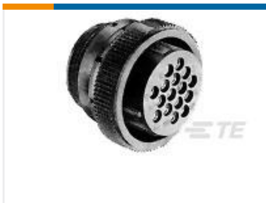
TE 产品编号183039-1 SIZE 17-14 CPC PLUG ASS'YSTD S