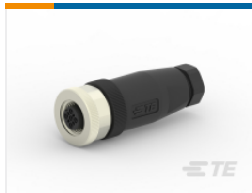
TE 产品编号T4110001041-000 M12,FEMALE,STRAIGHT,A CODE,4P, PG7,GOLD