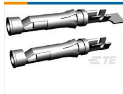
TE 产品编号1-66101-9 III+ SKT,18-16,TIN ,LP