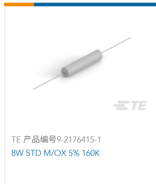
TE 产品编号 9-2176415-1 8W STD M/OX 5% 160K