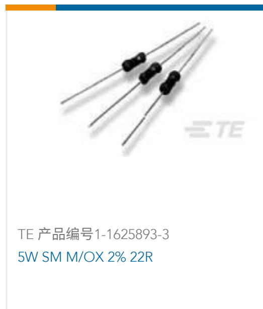
TE 产品编号 1-1625893-3 5W SM M/OX 2% 22R