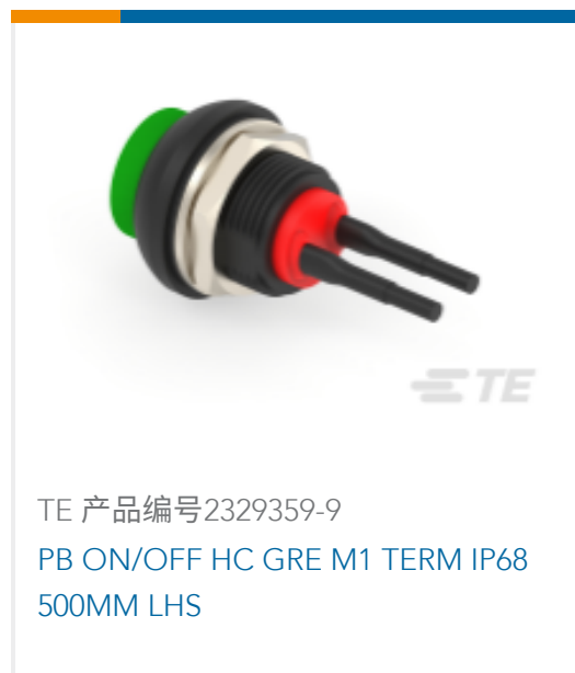
TE 产品编号 2329359-9 PB ON/OFF HC GRE M1 TERM IP68 500MM LHS