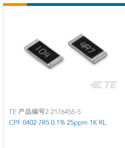
TE 产品编号 2-2176455-5 CPF 0402 7R5 0.1% 25ppm 1K RL