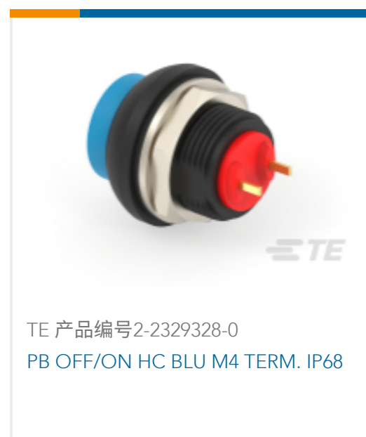
TE 产品编号 2-2329328-0 PB OFF/ON HC BLU M4 TERM. IP68