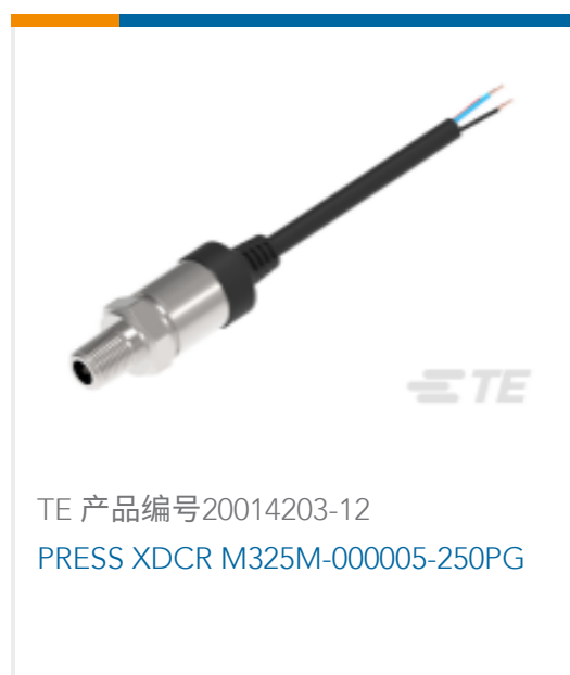
TE 产品编号 20014203-12 PRESS XDCR M325M-000005-250PG