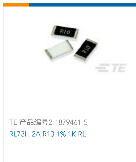
TE 产品编号 2-1879461-5 RL73H 2A R13 1% 1K RL