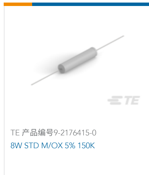
TE 产品编号 9-2176415-0 8W STD M/OX 5% 150K