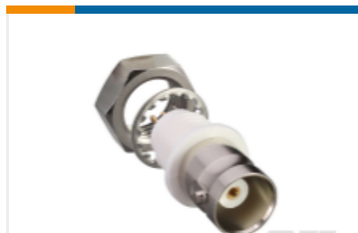
TE 产品编号CONBNC004 BNC Jack 50 Ohm Panel Mount