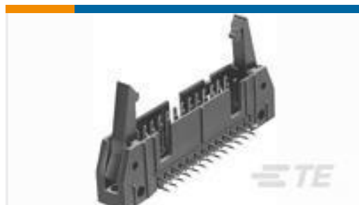
TE 产品编号5499141-2 A/L UNIV HDR 14P RA LG LAT