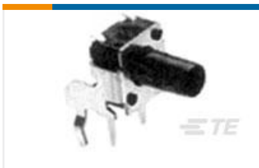
TE 产品编号1825027-8 FSMRA3JH04=R/A,TACT PB SW,160G