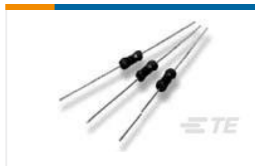
TE 产品编号9-1879350-6 RR01 5% 2K0 AMMO