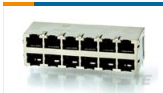
TE 产品编号5569263-1 STK MJ,8POS,2X6,SHLD,CAT5