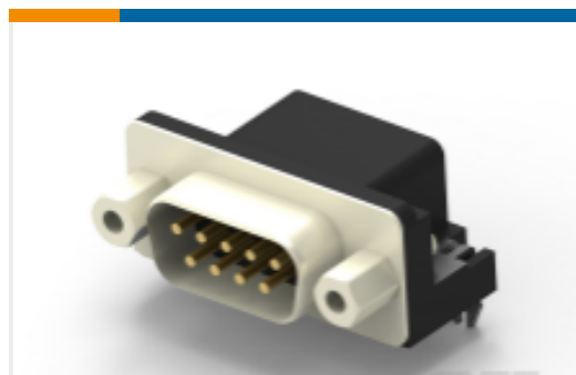
TE 产品编号2301843-2 AMPL PLUG HD20, R/A, 9P, B/L,4-40 S /LOCK