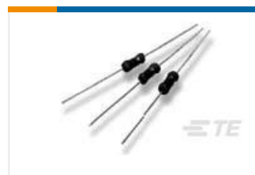
TE 产品编号1-1625893-3 5W SM M/OX 2% 22R