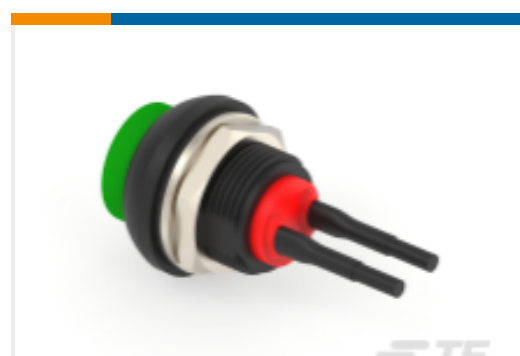
TE 产品编号2329359-9 PB ON/OFF HC GRE M1 TERM IP68 500MM LHS