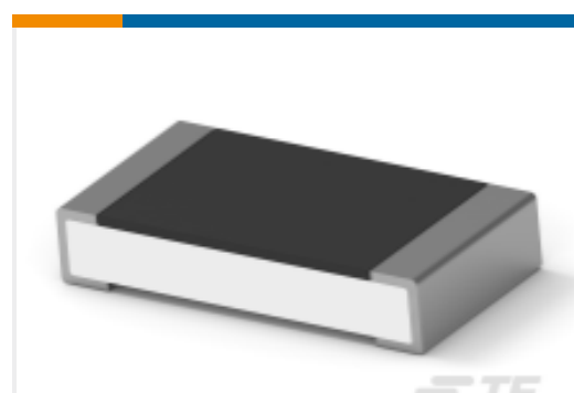
TE 产品编号1-2176391-0 RQ 1206 15K4 0.1% 10PPM 5K RL