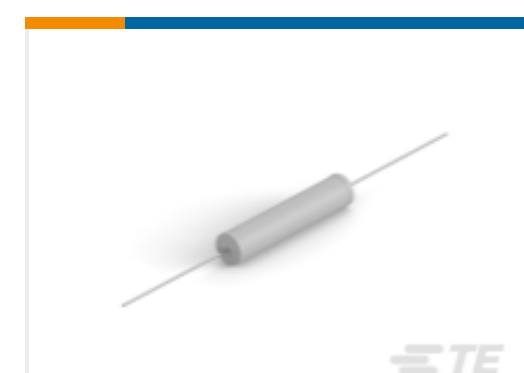
TE 产品编号9-2176415-1 8W STD M/OX 5% 160K