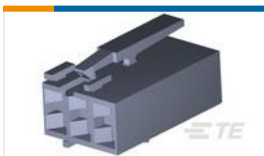
TE 产品编号2-1241961-7 STD TIM HOUSING MKII 3POS