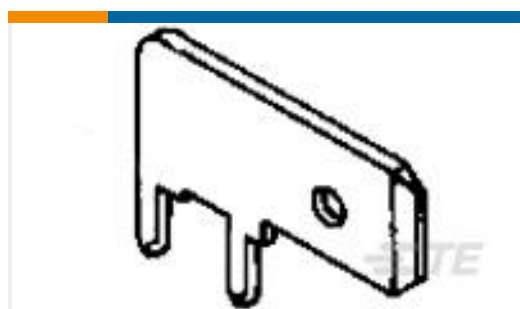
TE 产品编号928814-1 250 FASTON TAB TPBR