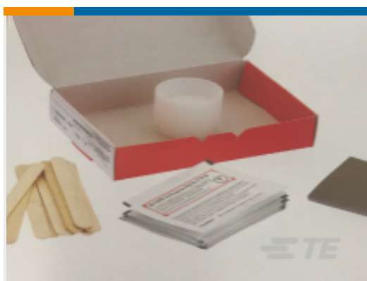
TE 产品编号890036-000 S1009-KIT-A