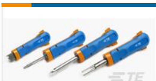
TE 产品编号6-1579007-1 EXTRACTION TOOL