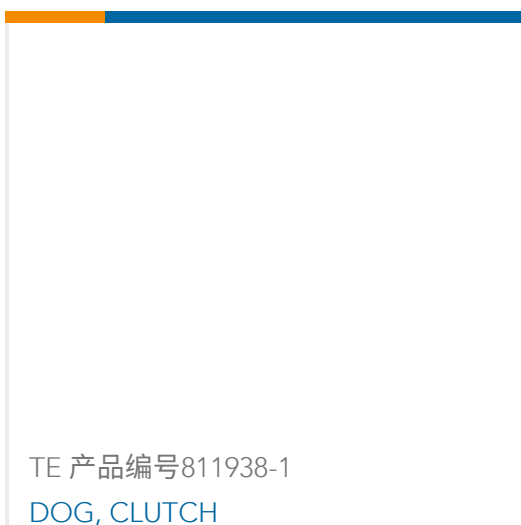
TE 产品编号811938-1 DOG, CLUTCH