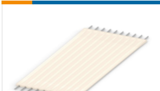
TE 产品编号8-6437125-5 FSN-23AB-14