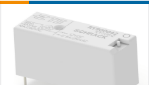
TE 产品编号4-1393225-6 RY900042 (RY211012)