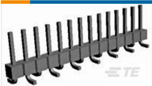
TE 产品编号1241150-3 3P MOD II BREAK AWAY HDR,SMD, BLISTER