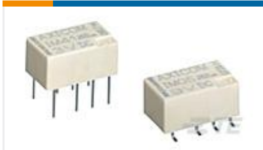
TE 产品编号9-1462037-9 IM06CGR=IM RELAY 140mW12V HDV