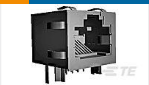
TE 产品编号1-406541-8 MJ,INV,1X1,0PNL G.,100"ST,SN