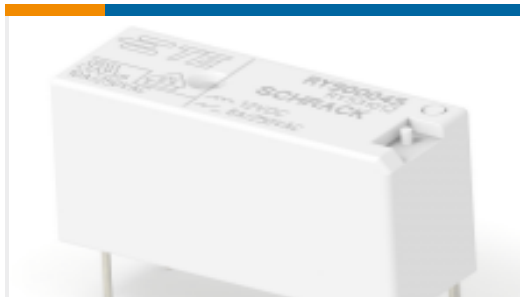
TE 产品编号4-1393225-9 RY900045 (RY531012)