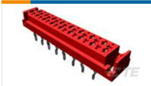
TE 产品编号1-338068-0 MICRO-MATCH FTE,10P