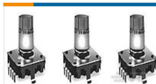
TE 产品编号 4-1879314-5 DPL12S 24P 24DET 25K RD/GRN