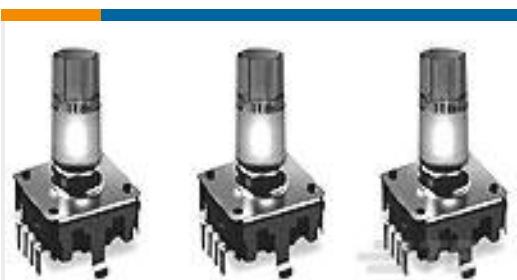
TE 产品编号 4-1879314-5 DPL12S 24P 24DET 25K RD/GRN