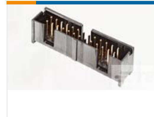
TE 产品编号2-1761603-9 IDC LOW PRO HDR 26P VERT BLUE