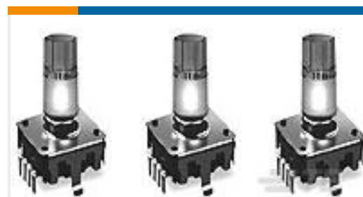
TE 产品编号 2-1879749-2 LED ENCODER 12MM HORIZ SW BL /OR