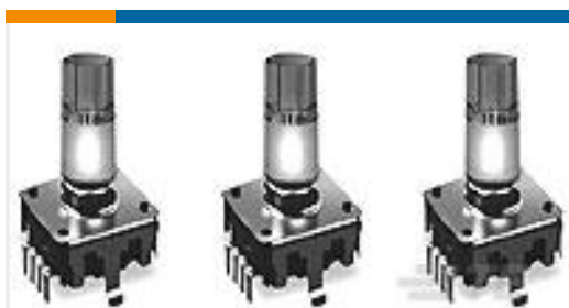
TE 产品编号 1879749-8 LED ENCODER 12MM HORIZ DET RED