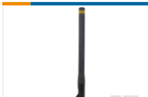
TE 产品编号ANT-916-CW-HWR-RPS Antenna 1/2 Wave Whip Swivel 916MHz RPS