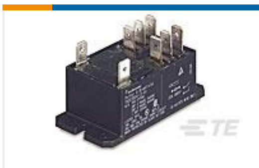
TE 产品编号6-1393211-5 T92P7D12-12