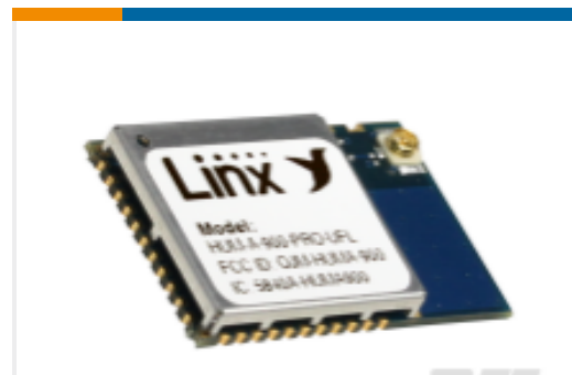
TE 产品编号HUM-A-900-PRO-UFL Module HUM-PRO-A 900MHz FHSS FM XCVR FCC