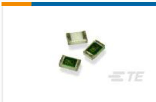
TE 产品编号1614959-8 CPF0805 1M1 0.1% 25PPM 1K RL