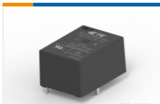
TE 产品编号1558661-5 T9GV1L14-18