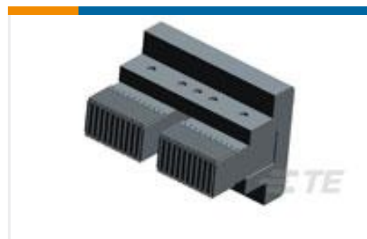
TE 产品编号90753-1 SEATING TOOL ASSY H.M. 154 PIN