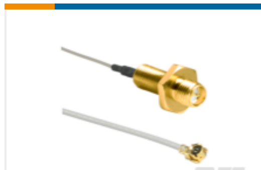
TE 产品编号CSI-RGFE-200-UFFR RP-SMA to U.FL/MHF1 200mm 1.13 OD