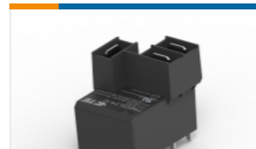
TE 产品编号1558676-7 T9GS1L24-24