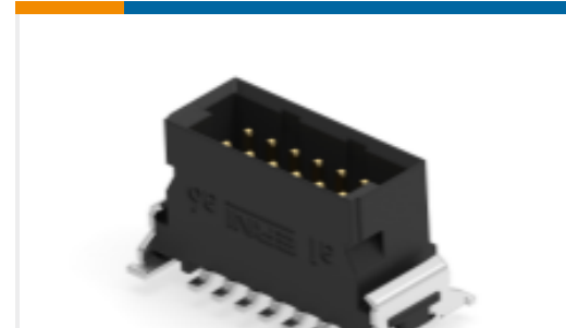
TE 产品编号244836-E SMCQ 12 M AB VV 8-13 CL * H007 137 E005