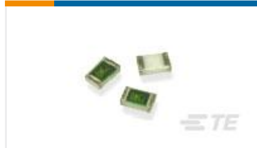
TE 产品编号3-2176089-6 RP 1J 0.166W 26K1 0.1% 25PPM 1K RL