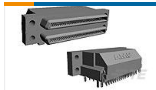
TE 产品编号5787962-1 .8MM CHAMP STACK RCPT ASSY