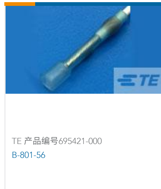
TE 产品编号695421-000 B-801-56