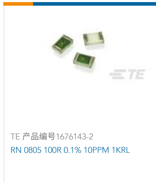
TE 产品编号1676143-2 RN 0805 100R 0.1% 10PPM 1KRL