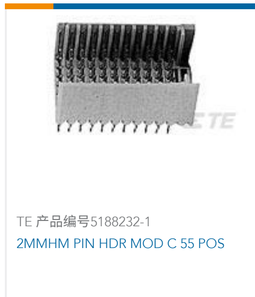
TE 产品编号5188232-1 2MMHM PIN HDR MOD C 55 POS