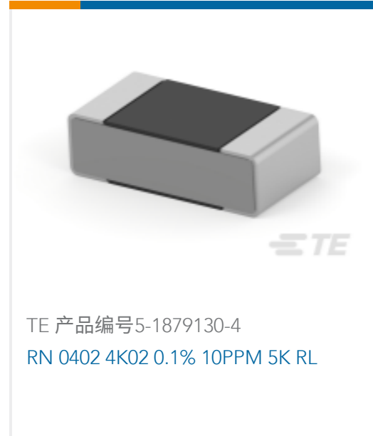
TE 产品编号5-1879130-4 RN 0402 4K02 0.1% 10PPM 5K RL