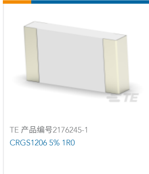
TE 产品编号2176245-1 CRGS1206 5% 1R0