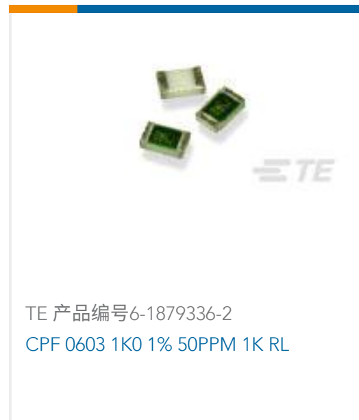
TE 产品编号6-1879336-2 CPF 0603 1K0 1% 50PPM 1K RL