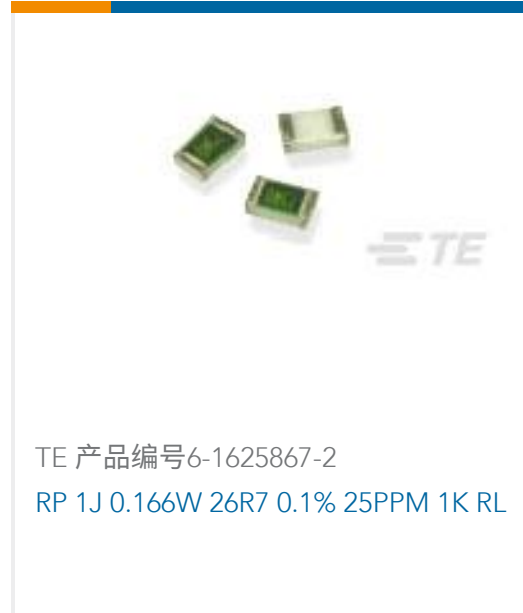
TE 产品编号6-1625867-2 RP 1J 0.166W 26R7 0.1% 25PPM 1K RL