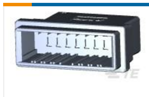
TE 产品编号178964-7 DYNAMIC D-3 W-T-W TAB HSG 16P