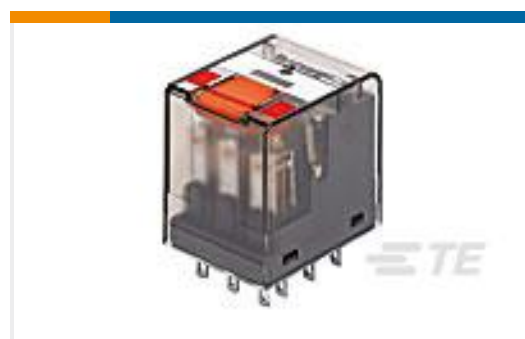
TE 产品编号8-1415001-1 PT570T30