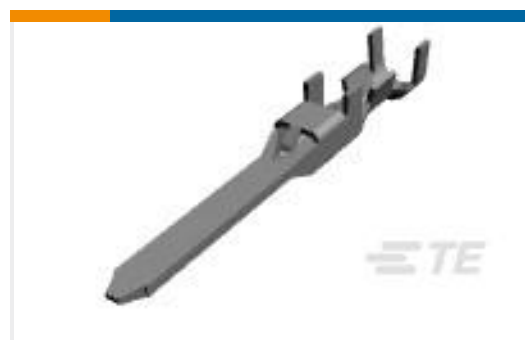
TE 产品编号175288-2 DYNAMIC D-3 TAB CONT. M AU 0.38 L/P