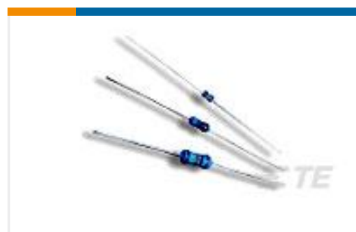
TE 产品编号1622603-1 LR1L 5% R47