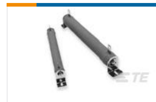
TE 产品编号3-1879448-9 TE 300W 1K5 5% Bracket