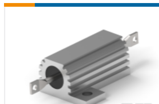
TE 产品编号4-1879075-9 功率电阻器：铝壳体，75 瓦特