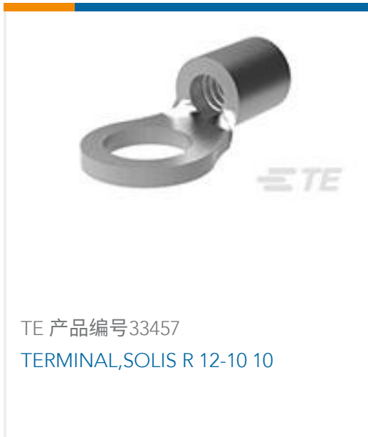
TE 产品编号33457 TERMINAL,SOLIS R 12-10 10