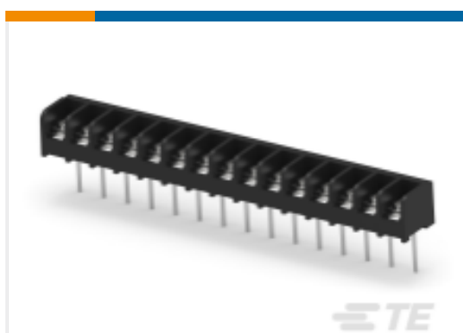
TE 产品编号2-796608-3 6WWV-15-008=#6 TRIBARRIER