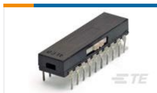
TE 产品编号6-1825011-4 ASF62RG04=6PDT AUTOSLIDE