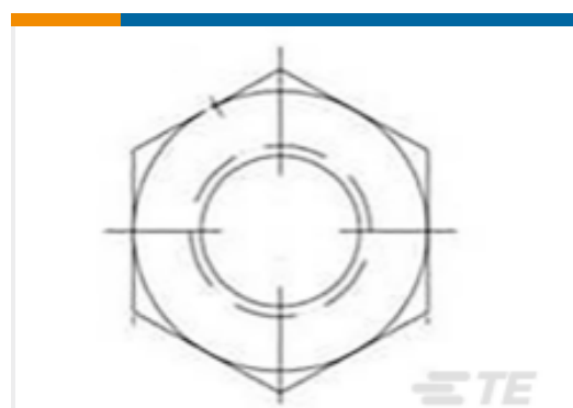
TE 产品编号1-328690-2 JAM NUT, GOLD PLATED