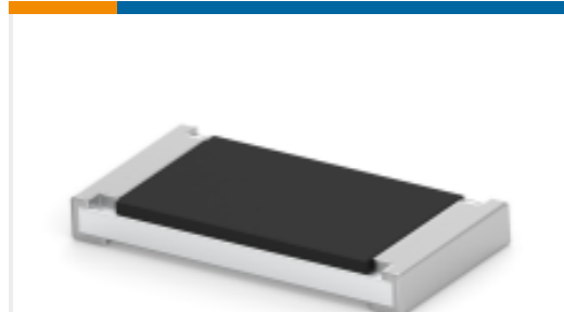
TE 产品编号9-1622824-0 厚膜电阻器：电流感应