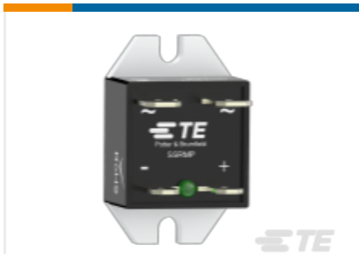
TE 产品编号2323802-3 SSRMP-240D10 = Mini Puck, 10A, 240V AC