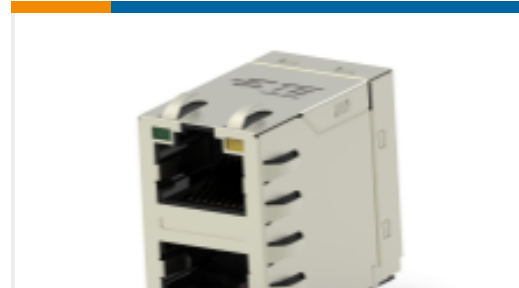
TE 产品编号5-2337995-1 RJ45 JACK MAG. POE 10/100 LED 2X1