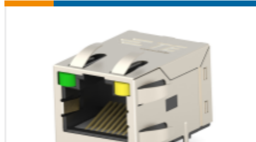
TE 产品编号2337992-3 RJ45 JACK MAG. POE 10/100 LED 1X1 INV.