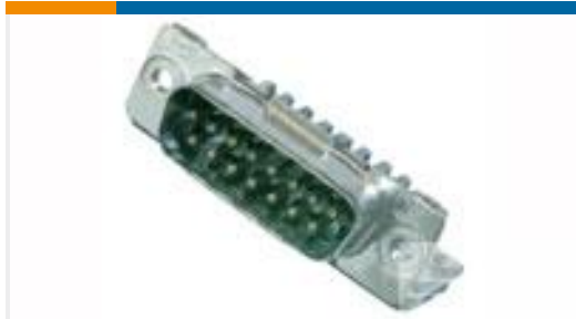
TE 产品编号338170-2 25P.HDP20 PLUG ASSY