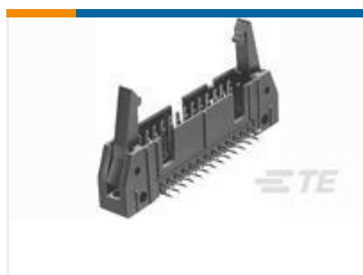
TE 产品编号5499141-5 A/L UNIV HDR 24P RA LG LAT