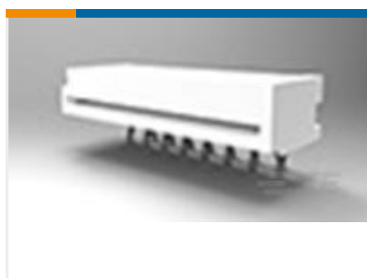
TE 产品编号4-84533-0 1.25MM FFC POST PLATED H 40P