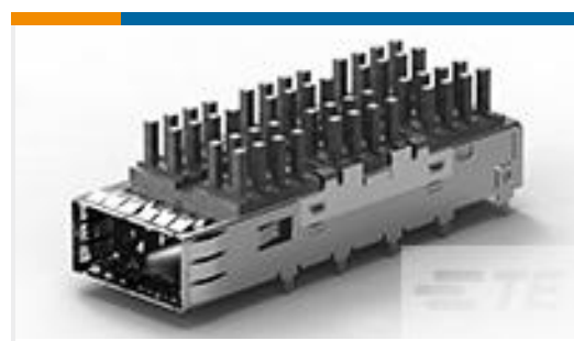
TE 产品编号2170450-1 Cage Assy W/Hsink, Thru Bezel,