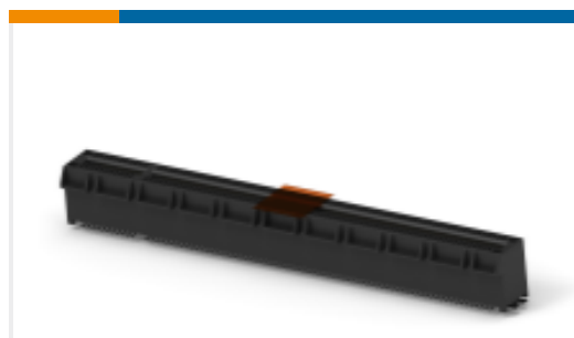
TE 产品编号 5-2337939-4 PCIE GEN4 CON,SMT,164POS,30u", MYLAR,HT