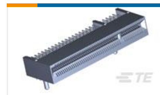
TE 产品编号3-1761465-4 pci expres ra assy 5.8mm thru hole 3.1 mm