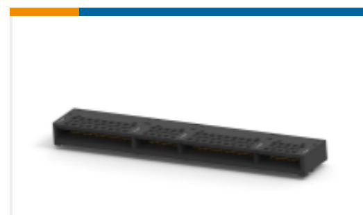
TE 产品编号2336568-1 RECEPT ASSY, RA, 168 POS, SLIVER 2.0