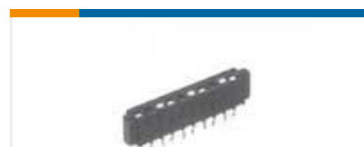
TE 产品编号5-520315-3 TRIOMATE ASSY V 3P L=3.556LDFR