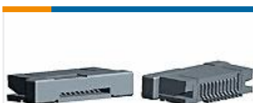
TE 产品编号2-1734592-9 FPC CONN. 0.5MM PITCH B/C, 29P